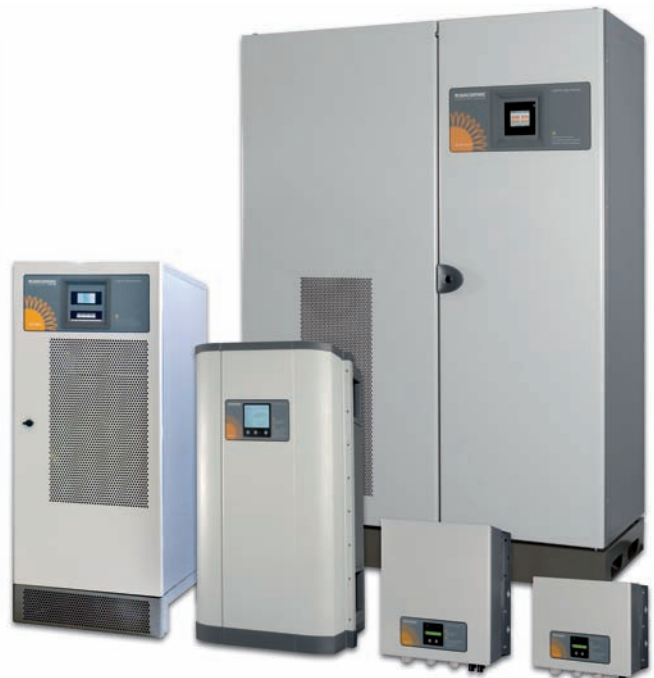
GAMME 120 C